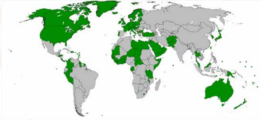
“خريطة الدول التي تعترف باستقلال كوسوفو” ٣

في عام 2008، أعلنت كوسوفو الاستقلال من جانب واحد واعترفت 99 دولة باستقلال كوسوفو، كالولايات المتحدة وبريطانيا ومعظم دول الاتحاد الأوروبي. بينما وقفت كل من روسيا والصين، ضد استقلال كوسوفو، وبالطبع توعدت صربيا بأنها لن تعترف بكوسوفو كدولة مستقلة.