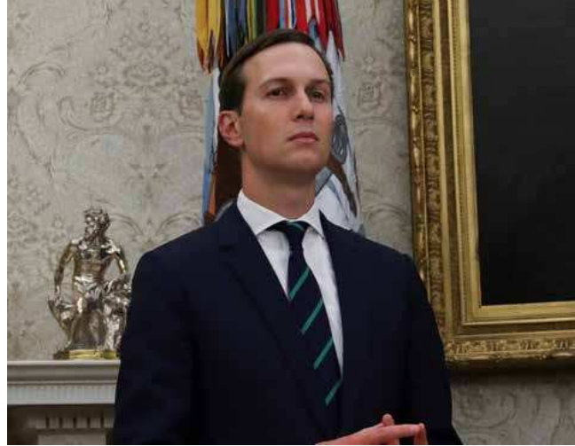
كوشنر صهر ترامب ومستشاره السياسي

كواليسُ بعضِ أحداثِ المنطقةِ العربيةِ والشرقِ الأوسطِ